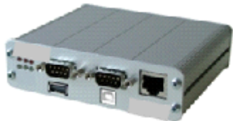
Modem MC 07

Fahrtenbuch, Spurverfolgung, Fahrzeugdaten (FMS)