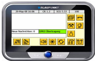
Touch Screen Display

Arbeitszeit, Be- und Entladen, Kommunikation mit Fahrer